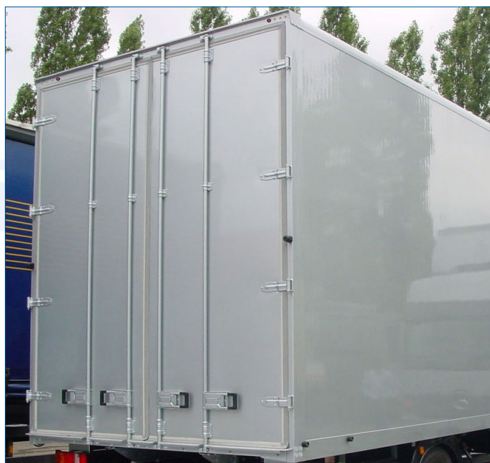
Zamki ryglowe obrotowe zewnętrzne