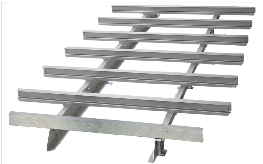
zmontowana rama podwozia