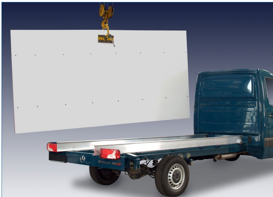
dla normalnej wysokości podwozia