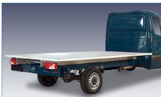
z aluminiowymi podłużnicami (nie nadają się do niskiego podwozia)