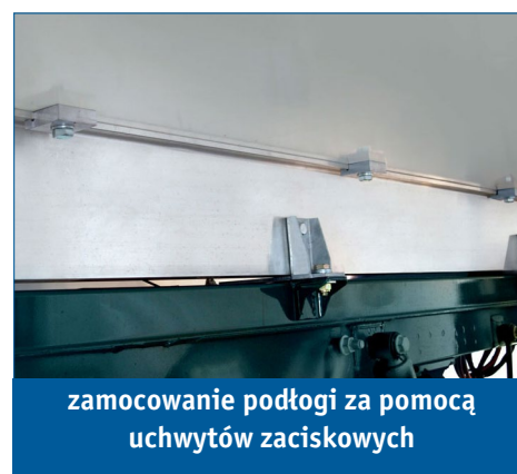
zamocowanie podłogi za pomocą uchwytów zaciskowych