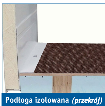
Podłoga izolowana (przekrój)