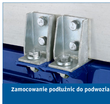
Zamocowanie podłużnic do podwozia