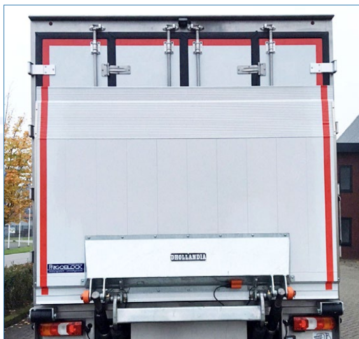
Zamki ryglowe obrotowe zewnętrzne

Zamiast zamka ryglowego z drążkami opcjonalnie zamek ryglowy z cięgnami