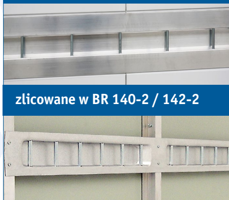
zlicowane w BR 140-2 / 142-2